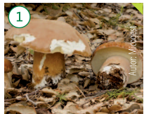
Boleto de verano Boletus aestivalis

HÁBITAT: Frecuente en alcornocales, castañares y encinares. CARACTERÍSTICAS: Sombrero de 6 a 25 cm de diámetro, convexo al principio para ir tornándose a amarillos verdosos y al final verde oliváceo. Pie grueso, pardusco, ventruado al principio y después más esbelto, con redicilla muy extendida.