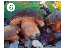
Tentullo Boletus aereus

HÁBITAT: Frecuente en alcornocales, castañares y encinares. CARACTERÍSTICAS: Sombrero de 6 a 18 cm de diámetro, al principio semiesférico, después convexo-aplanado, cutícula, seca y aterciopelada de color variable pardo oscuro. Poros blancos en su juventud pasando a tonos amarillo verdoso en la vejez. Pie duro, robusto, engrosado en la base y luego cilíndrico de color parduzco.