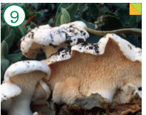
Lengua de gato, de oveja o de vaca Hydnum repandum

HÁBITAT: En encinares y más raramente en pinares, formando grupos o "corros de brujas". CARACTERÍSTICAS: Sombrero de 4 a 12 cm de diámetro, amarillo o blanquecino, aplanado, bastante carnoso, de morfología muy irregular, seco y aterciopelado, con borde lobulado. En lugar de láminas o poros, poseen numerosos agujeros o púas que se desprenden fácilmente al tocarlos. Pie excéntrico, corto y macizo que con frecuencia crece unido al de otros ejemplares.