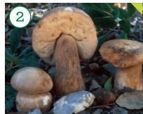
Calabaza Boletus edulis

HÁBITAT: Frecuente en alcornocales, encinares y matorral mediterráneo. CARACTERÍSTICAS: Sombrero de 7 a 15 cm de diámetro, al principio semiesférico, después convexo-aplanado, cutícula un poco viscosa, lisa o suavemente rugosa de color variable pardo crema. Poros blancos al principio hasta tornarse a amarillo-verdoso. Pie grueso, blanquecino en la base.