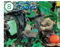
Trompeta de los muertos Craterellus cornucopioides

HÁBITAT: En alcornocales y quejigales, preferentemente en zonas húmedas. CARACTERÍSTICAS: Forma de trompeta o embudo, de hasta 10 cm de diámetro. Margen enrollado de forma irregular, después ondulado, lobulado. Color pardo-negruzco según la humedad y superficie fibroso-escamosa. Pie apenas distinguible del sombrero, hueco.