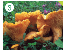
Rebozuelo Cantharellus subpruinus

HÁBITAT: Frecuente y abundante bajo alcornocales, castaños, encinas, pinos y en bosques mixtos de estas especies. CARACTERÍSTICAS: Sombrero irregular de 3 a 10 cm de diámetro generalmente con forma de embudo, de color amarillo como yema de huevo. En lugar de láminas, presenta pliegues muy ramificados. Pie cilíndrico amarillo del mismo color que el sombrero.