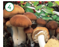
Seta de Chopo Agrocybe cylindracea

HÁBITAT: Sobre tocones y troncos viejos de álamos principalmente, también en higueras, olmos, nogales, etc. CARACTERÍSTICAS: Sombrero de 3 a 14 cm de diámetro, al principio semiesférico y después extendido, de color parduzco. Láminas apretadas, blancas al principio y ocreas en la madurez. Pie largo, esbelto, duro, fibroso de color blanco pálido con anillo persistente de color blanco.