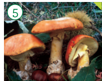
Tana Amanita caesarea

HÁBITAT: Alcornocales, castañares y encinares. CARACTERÍSTICAS: Sombrero de 8 a 16 cm de diámetro, carnoso, hemisférico, cutícula viscosa fácil de separar de color naranja vivo. Láminas de color amarillo-oro. Pie del mismo color que las láminas, grueso, carnoso, con anillo, volva amplia y membranosa de color blanquecino.