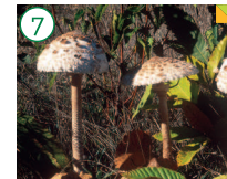
Gallipierno Macrolepiota proceca

HÁBITAT: Frecuente y abundante en diversos hábitat, bajo alcornocales, castaños, encinas, claros de bosques, etc. CARACTERÍSTICAS: Sombrero de 10 a 25 cm de diámetro: De joven ovoide y luego se expande y aplanada. Cutícula con multitud de escamas de tono tostado sobre un fondo blanquecino. Láminas libres y apretadas. Pie alto, hueco, bulboso en la base y fibroso con doble anillo.